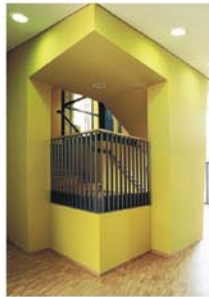
Photo: U. G. Jan-Ludwig, Lüneburg 10/2008 Photo: U. G. Jan-Ludwig, Lüneburg